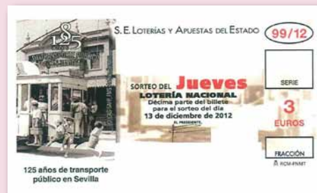
Boceto del décimo de lotería conmemorativo

Por último, recordar que el jueves 13 de diciembre la Sociedad Estatal de Loterías y Apuestas del Estado edita un décimo de Lotería Nacional con la imagen corporativa del 125 Aniversario del transporte público en Sevilla.