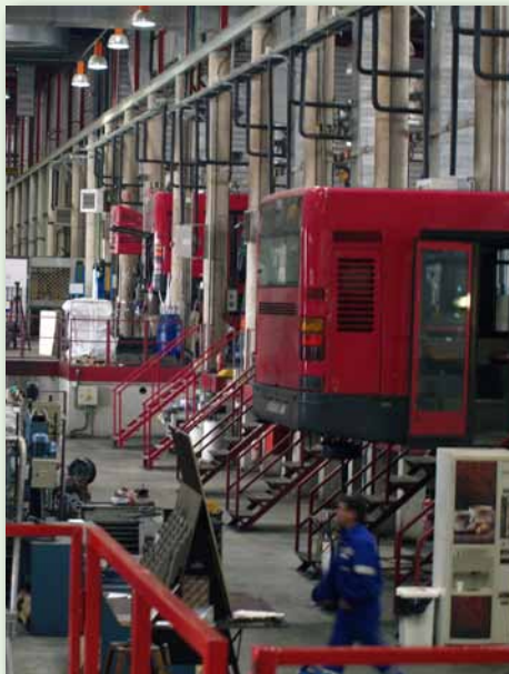
Sección de Montadores

Con ello se espera que los brillos, reflejos y las manchas se reduzcan y que se mejore la visión desde el puesto de conducción.