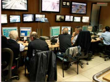
Conductores acompañando a controladores

En el Curso participan como formadores el Jefe de Área de Mantenimiento, un Maestro de Taller y el Jefe del Dpto. de Tráfico.